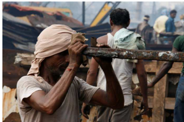
Werven van scheepssloperijen in India,