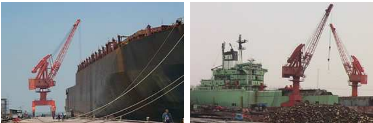
Werk van scheepssloperij in China, Website Changjiang Ship-Breaking Yard ( www.cjshipbr.com ), bezocht in september 2012.

In China zijn de nodige investeringen gedaan en de situatie in China is daardoor technisch vergelijkbaar met werven in OECD landen. Stichting De Noordzee vindt dat de goede sloopwerven in China daarom gepromoot zouden moeten worden. 19