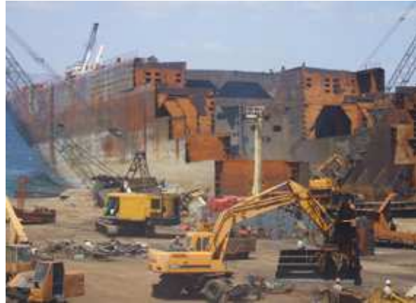
Werk van scheepssloperij in Turkije, Website Leyal Ship Dismantling & Recycling ( www.leyal.com.tr ), bezocht in september 2012.